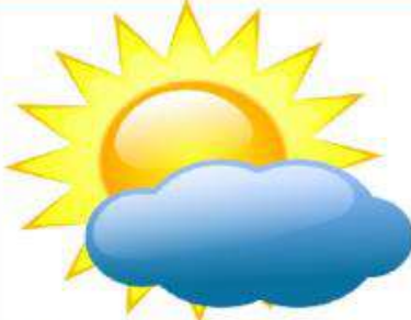
Ήλιος με Σύννεφα